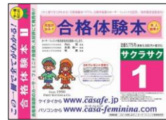
合格体験本「サクラサク」①